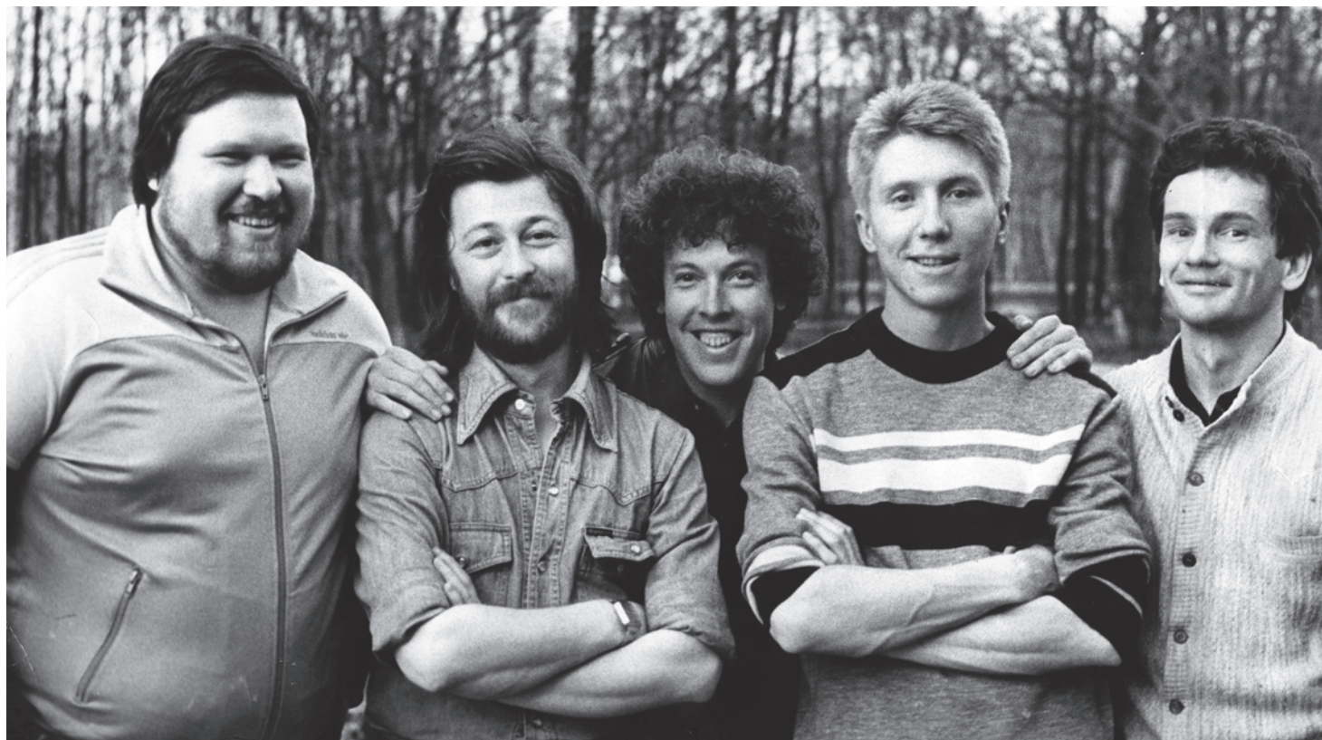
■ Автор сильно дружил с «Машиной». До выхода «Машины с евреями»...