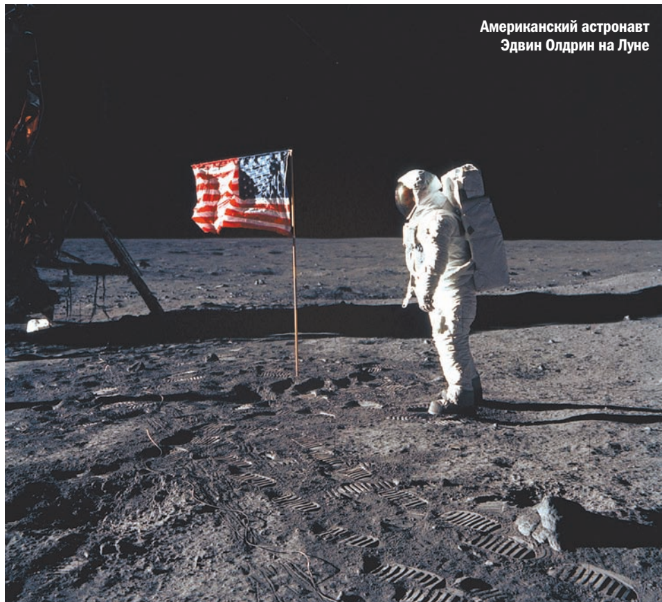
Американский астронавт Эдвин Олдрин на Луне

— Дело в том, что когда я занял кресло директора этого Института, то начал интересоваться всем спектром работ, которые мы вели. Это было начало 1990-х годов, и тогда шёл «Марс-94», который чуть позже стал «Марсом-96». Мне вскоре стало ясно, что такой масштабный проект мы не потянем — в стране была тяжёлая финансовая ситуация. И я открыто высказал свои сомнения. Но меня тут же «приструнили»: мол, этот проект финансируют международные организации, много средств вложили американцы и мы не вправе даже сомнения в его целесообразности высказывать. Я понимал, что приостановить «Марс-96» нельзя, тем не менее свою точку зрения не скрывал. Как известно,