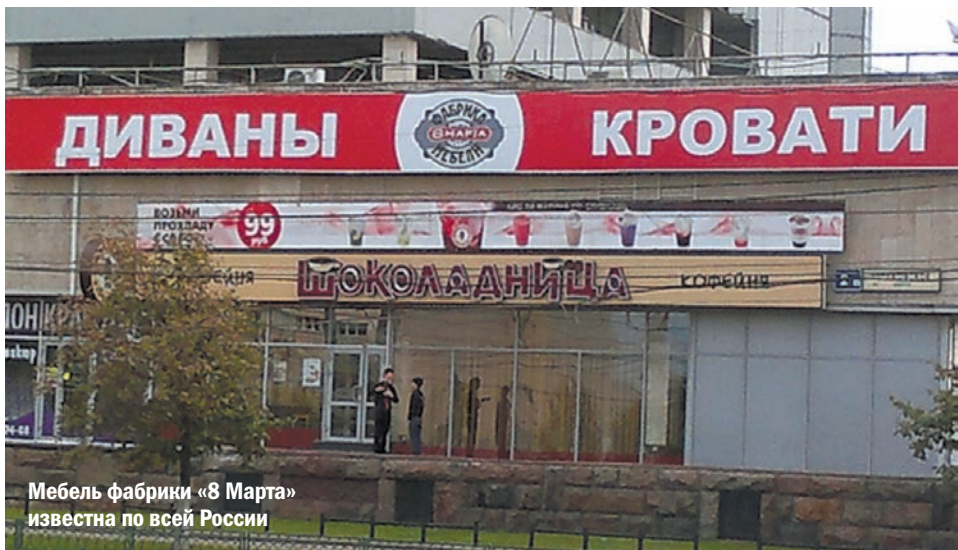
Мебель фабрики «8 Марта» известна по всей России