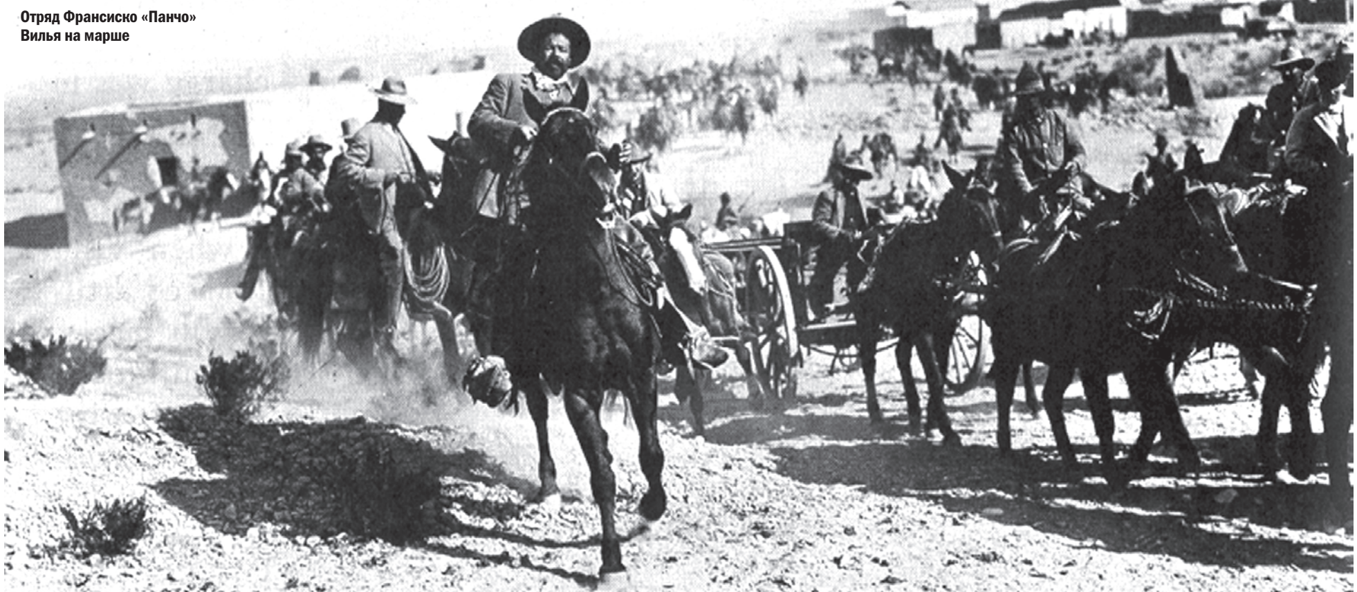
Отряд Франсиско «Панчо» Вилья на марше

По неизвестным причинам у Амброза с учёбой не задалось. Уже в пятнадцать лет он начал сам зарабатывать на жизнь, подвизаясь то официантом в салуне, то подносчиком