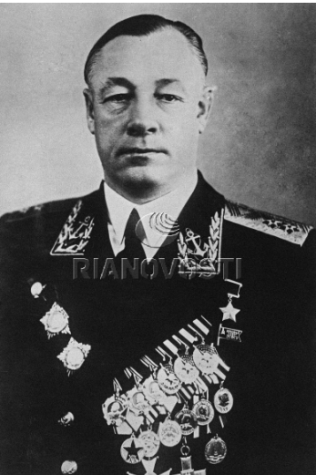
Адмирал Флота Советского Союза Николай Кузнецов

И Жуков, и др. маршалы не всё делали. Почему Кузнецова не критиковали? Панибратство.