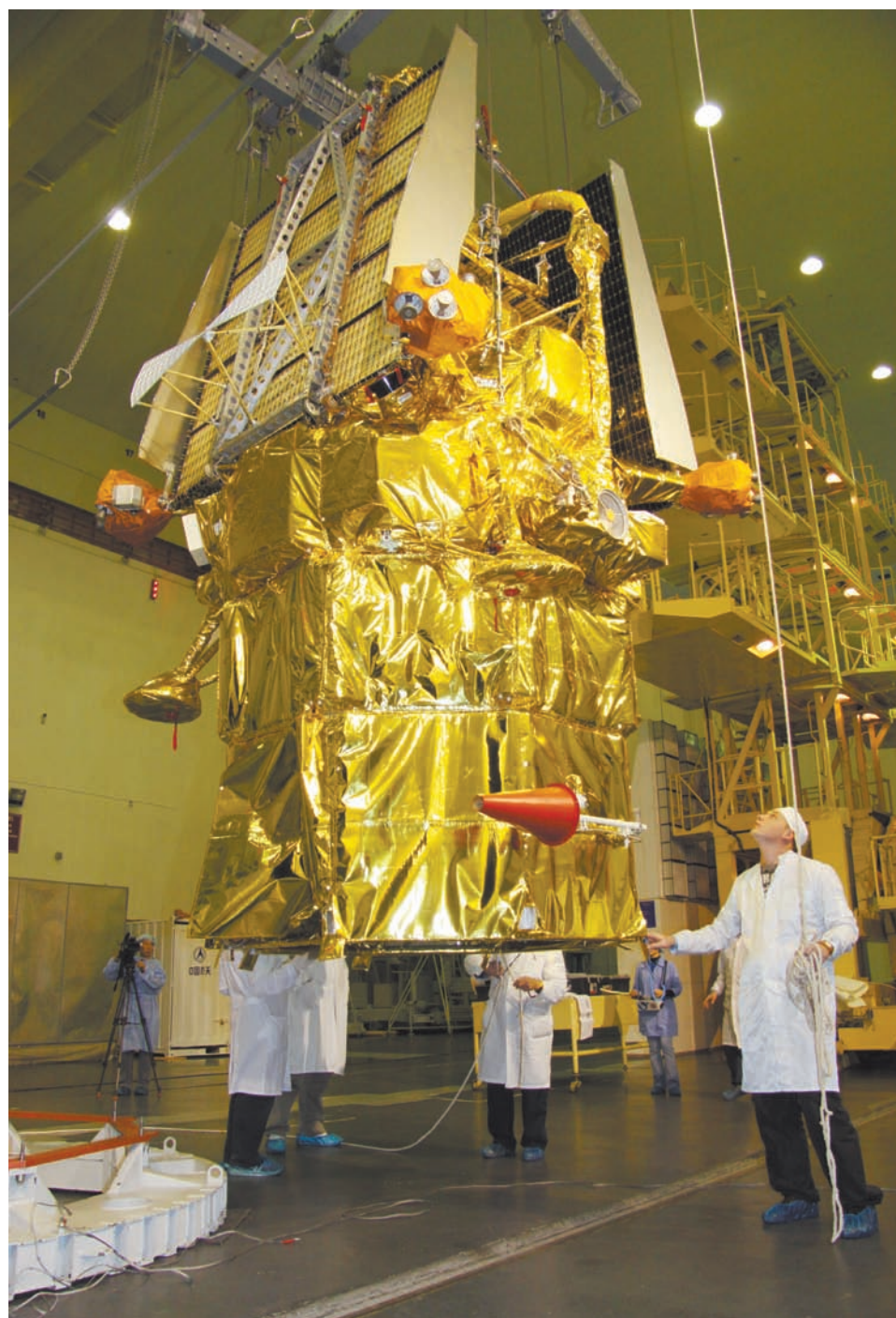
ОЛЕГ УРУСОВ / РИА «НОВОСТИ»