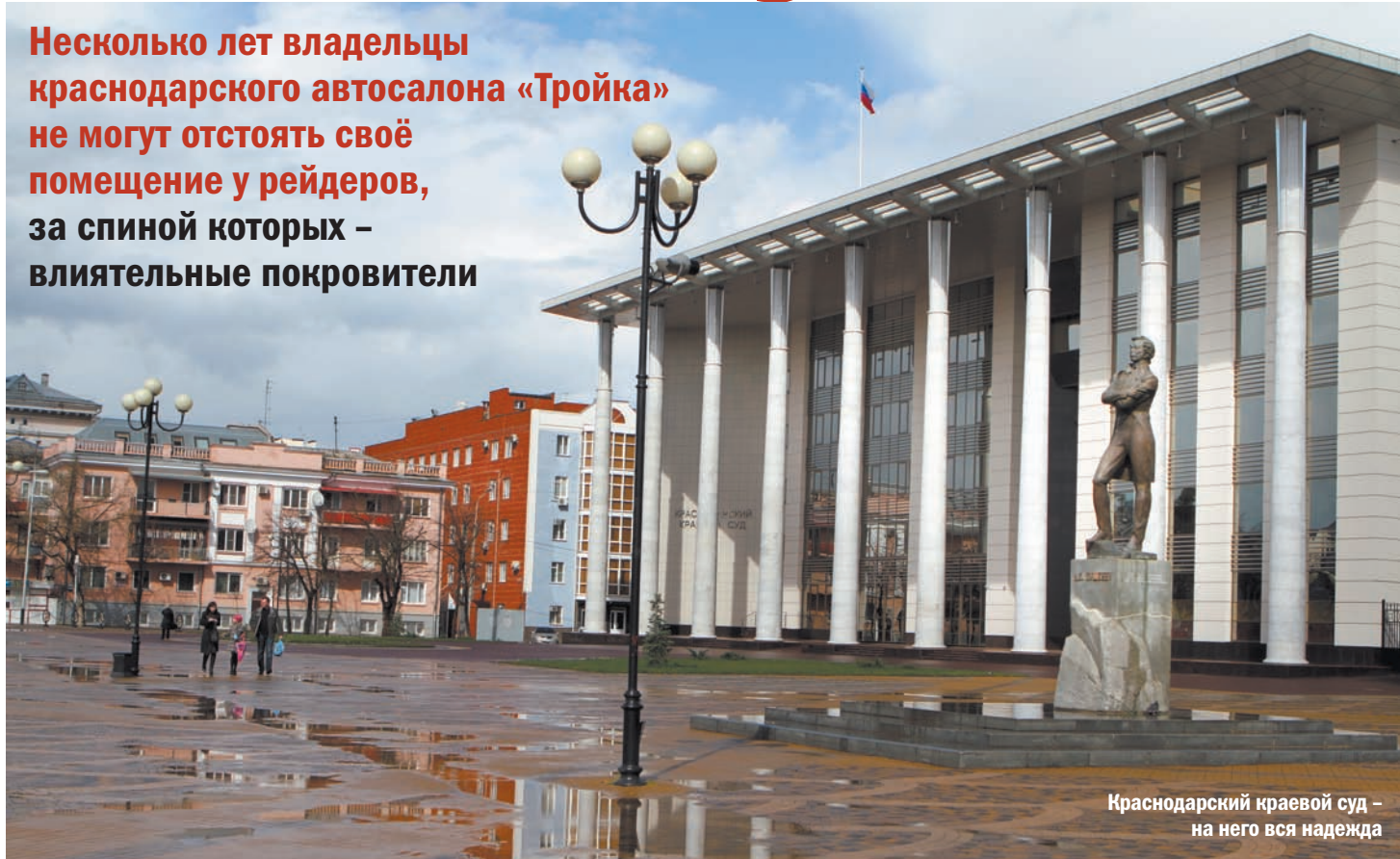
Краснодарский краевой суд – на него вся надежда

Несколько лет владельцы краснодарского автосалона «Тройка» не могут отстоять своё помещение у рейдеров, за спиной которых – влиятельные покровители