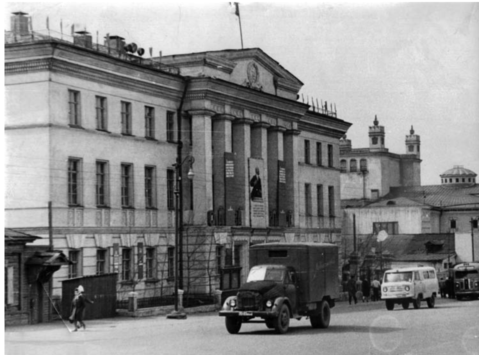
■ Здание Дома политпросвещения Улан-Удэ летом 1953 года тоже находилось в осаде

Улан-Удэ после бериевской амнистии: город в руках бандитов. Воспоминания очевидца