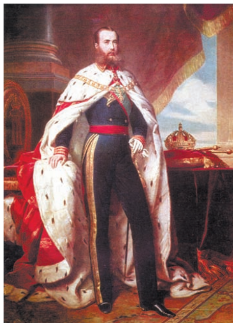
Император Мексики Максимилиан I, Фердинанд Максимилиан Иосиф фон Габсбург (наверху справа). Расстрелян мятежными мексиканскими республиканцами 19 июня 1867 г. (слева)

тельно превосходила императорские войска. Максимилиан решил отступить в город Керетаро, который считался оплотом консерваторов. Но этим император отрезал себе путь отступлению к побережью и лишился возможности бежать из страны.