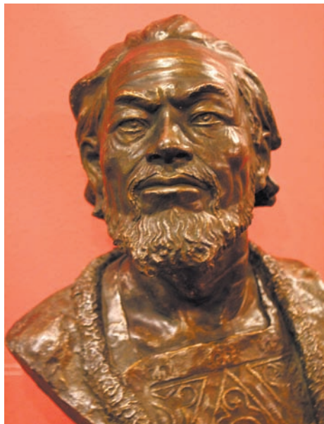
Реконструкция облика Андрея Боголюбского, великого князя Владимирского

Но вернёмся в послереволюционную Россию. В 1918 году, после отделения церкви от государства, регистрацию новорождённых стали вести отделы записи актов гражданского состояния (ЗАГС) и родителям была предоставлена полная свобода выбора. Можно было взять имя из святцев, любое заимствованное иностранное имя, предлагались и новые имена, наконец, сами родители могли изобрести новое, и их фантазии не было предела. Детей стали называть именами революционеров и известных исторических и литературных героев. Мгновенную популярность получили имена Марат, Спартак,