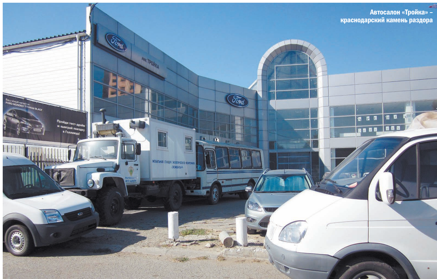
Автосалон «Тройка» – краснодарский камень раздора

Уже давно известен прайс-лист услуг пособников рейдеров. Цифры в нём меняются с годами только в сторону увеличения. Чтобы было понятно, какие деньги крутятся в процессе этих операций, приведу такую цифру. Только за вынесение судебного определения об аресте тех предприятий, на которые положили глаз рейдеры, они платят от 200 до 400 тысяч долларов. Несравненно выше гонорары лоббистов. Вот почему «чёрное рейдерство» практически ненаказуемо. И это, увы, на практике узнали сотрудники краснодарского автосалона «Тройка», судьба которого сейчас решается в Первомайском суде Краснодара. Мы будем следить за ходом событий. ■