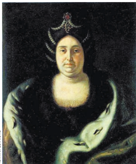
Прасковья Салтыкова, супруга царя Иоанна Алексеевича, брата Петра I

Множество имён было образовано от революционных лозунгов, названий учреждений и тому подобного. Например, Икки (Исполнительный Комитет Коммунистического Интернационала), Кро (контрразведывательное отделение), Роблен (родился быть ленинцем), Ремизан (революция мировая занялась), Реввола (революционная волна), Тролен (Троцкий, Ленин), Винун (В.И. Ленин не умрёт никогда), Компро (коммунизм, пролетариат), Диамара (диалектический материализм), Ревдит (революционное дитя), Лорикэрик (Ленин, Октябрьская революция, индустриализация, коллективизация, электрификация и коммунизм), Оюшминальда (Отто Юльевич Шмидт на льдине), Лоризкс (Ленин, Октябрьская революция, индустриализация, электрификация, коллективизация, социализм), Польза (помни ленинские заветы) и Силен (сила Ленина). Последнее имя звучало особенно пикантно, так как силенов в искусстве отождествляли с сатирами и обычно изображали в виде уродливых, абсолютно непристойных существ с лошадиными хвостами и копытами. Давали несчастным детям и такие имена, как Цас (центральный аптечный склад), Крармия (Красная армия), Райтия (районная типография) и совсем просто, без сокращения – Артиллерийская академия, Серп-и-Молот, Догнат-и Перегнат.