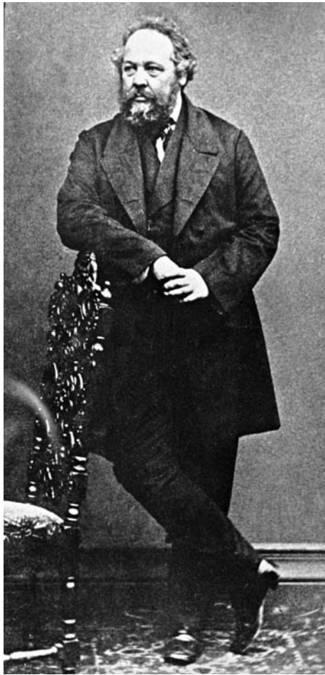
■ Теоретик анархизма Михаил Бакунин

Потом он издал «Словарь Сатаны», не имевший никакого отношения к теологии и