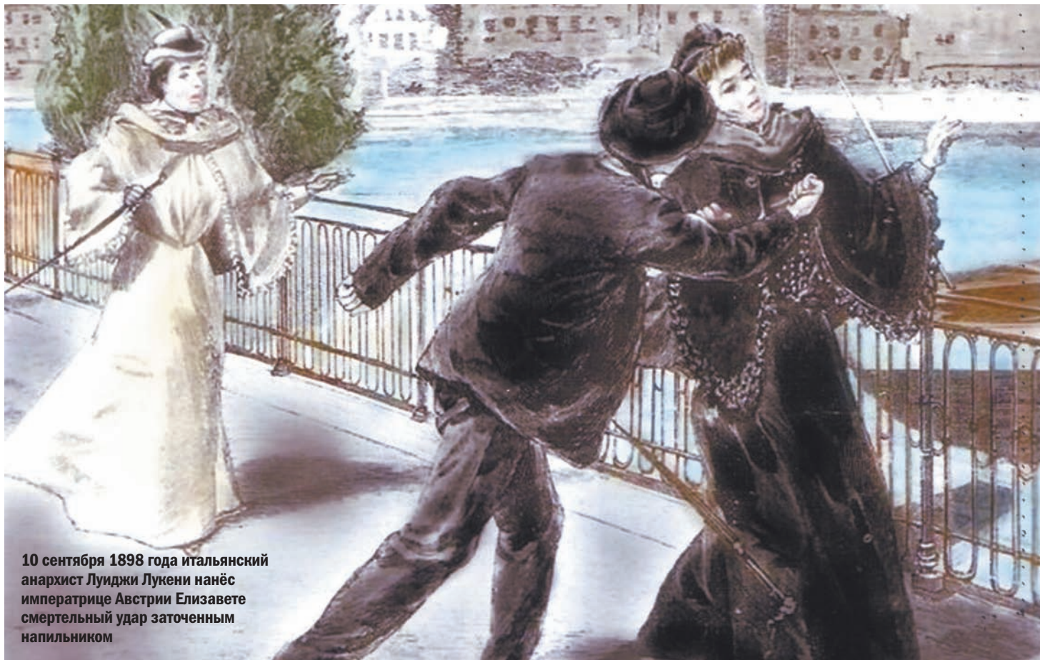
10 сентября 1898 года итальянский анархист Луиджи Лукени нанёс императрице Австрии Елизавете смертельный удар заточенным напильником

Сергей MAKEEV: www.sergey-makeev.ru , post@sergey-makeev.ru .