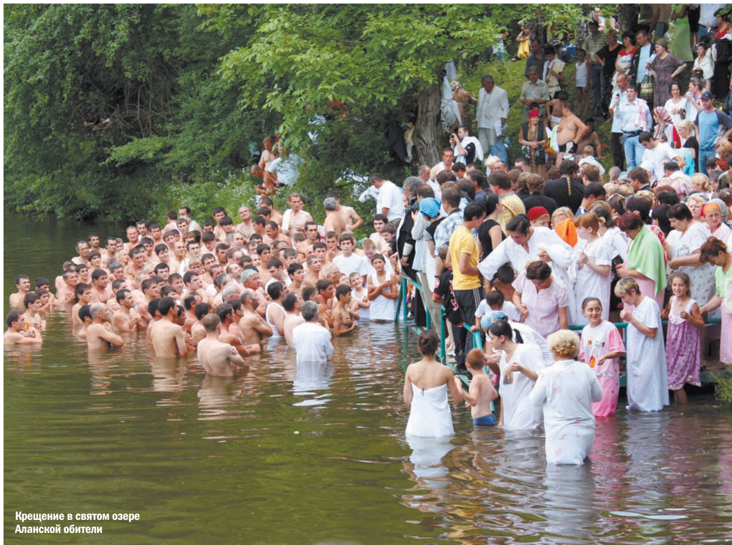
Крещение в святом озере Аланской обители

В обширном пантеоне осетинских аланских святых (а христианство Алания приняла задолго до крещения Руси) особо почитаема Нана Задалеская. Нана по-осетински – мать. В её житии рассказано, как после нашествия монголо-татар пошла Нана по опустошённой земле, собирала детей и спасала тем род аланский от уничтожения. ■