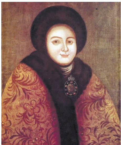
Первая супруга Петра I Евдокия Лопухина